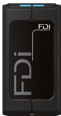
Lesegerät P 40 FD-020-220 Art.-Nr. 74921