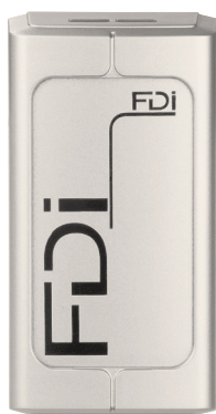
Lesegerät P40 silber FD-020-244 Art.-Nr. 74926