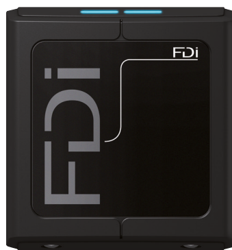
Lesegerät P80 FD-020-221 Art.-Nr. 74922