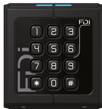
Lesegerät Codeschloss PK80 FD-020-222* Art.-Nr. 74923

Die Zwei-Draht-Bus-Lesegeräte der 2Smart-Reihe für den Nahbereich mit 13,56 MHz wurden für den Betrieb mit iPassan und Easy Door Controller entwickelt. In beiden Fällen ist der 2-Draht-Bus proprietär gesichert. Alle Lesegeräte verfügen über zwei LED-Anzeigen in Blau und Rot bzw. Grün sowie einen Summer. In Verbindung mit einem iPassan Controller ist das Ansteuern der LEDs und des Summers einstellbar. Standardmäßig leuchtet die blaue LED als Anzeige des Betriebsmodus dauerhaft. Die zweite LED-Anzeige leuchtet Grün, wenn der Zutritt gewährt wird, und intermittierend Rot, wenn der Zutritt verweigert wird. Bei Zutrittsgewährung erklingt vom Summer ein kontinuierlicher Signalton, bei Zutrittsverweigerung ein intermittierender Signalton.